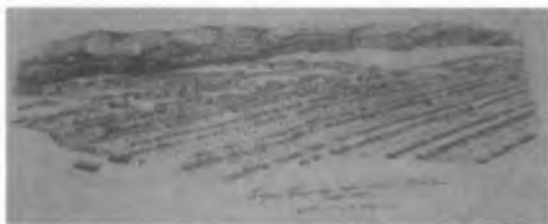
Панорамный рисунок Барнаула. Художник В.П. Петров. 1808 г.

Принцип регулярности застройки, о которой упоминает К. Ледебур в 1826 г., хорошо отражает план Барнаула 1856 г. из фондов Центрального хранения архивного фонда Алтайского края (ЦХАФ АК).