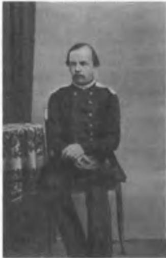
Ф.М. Достоевский в форме унтер-офицера. 1858 г. Семипалатинск. ©Литературно-мемориальный музей Ф.М.Достоевского города Семей (Казахстан). НВФ 1766/3

лы и прожиться в Семипалатинске.) <...> К тому времени наверно выйдет отставка, и в Семипалатинске я и лишнего дня не хочу сидеть» (28-1; 319-320). В письме А.Е. Врангелю от 22 сентября 1859 пишет, что в Семипалатинске («не осталось ни одной симпатической личности, ни одного светлого воспоминания» –28-1; 337).