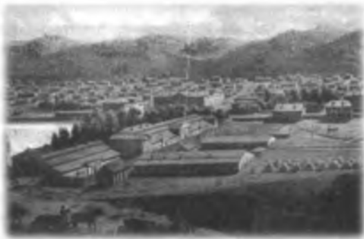
П.М. Кошаров. Серебро и золотоплавильный завод в Барнауле (Томская губерния). Русский художественный листок (СПб. : Литография В. Тимма, 1861) URL: https://antiquebooks.ru/book.php?book=111339

Горные инженеры в массе своей были людьми образованными, сведущими не только в своей профессии, но и в литературе и в искусстве. Не случайно именно в Барнауле возник первый в Сибири музей, основанный в 1823 г. В городе существовал любительский театр, хор и картинная галерея, окружное училище. При сереброплавильном заводе была открыта публичная библиотека, имевшая целью «...научное ознакомление с минералогией и горным делом и поэтому содержит главным образом сочинения по этим предметам» [Ледебур, 1993, с. 148]. Еще в XVIII в. в Барнауле появилась аптека – одна из самых первых аптек в России. По меркам того времени, Барнаул был довольно крупным городом: В 1858 г. в Барнауле было зарегистрировано 11681 человек, для сравнения в Кузнецке – менее 2000 (1655) [История Сибири, 1968, Т. 2, с. 415].