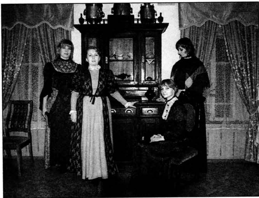
● Действующие лица театрализованного представления собрались в гостиной литературно-мемориального музея. 2010