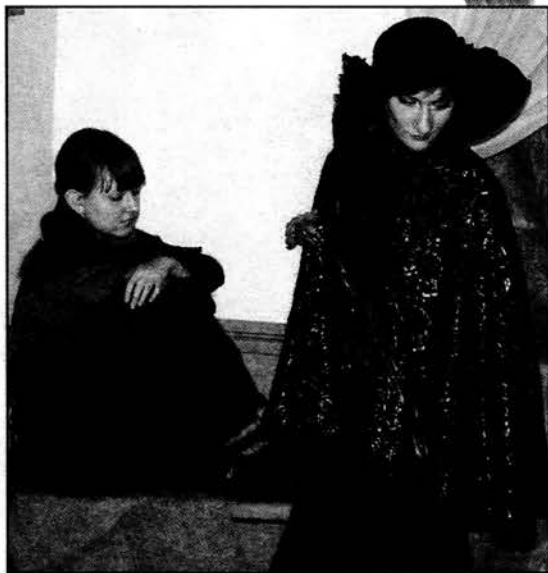
● Дама в чёрном навещает Нелли из романа «Униженные и оскорблённые» (Е. МИНГАЗОВА и Е. ПЛОТНИКОВА). 2012

ровой литературы. В сюжете «Ночи» переплелись биографические события и документы, воспоминания современников и личная переписка автора.