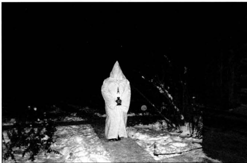
● Тень писателя бродит по музею. 2010