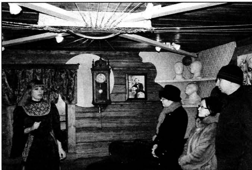
● Экскурсия начинается со знакомства с творчеством автора. 2010