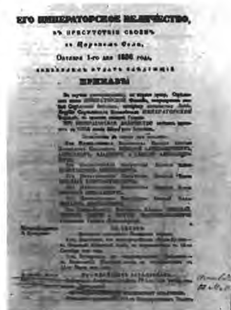
И. Тотлебен, Генерал-адъютант 1-го Императорского Величества как 1-го Императорского Величества и армянские и иранские Ф. М. Достоевского на 1 октября 1856 г. и Ф. М. Достоевского на чин прапорщика — 25 августа 1857 г.

Ф. М. Достоевский — И. Тотлебену. 24 марта. 1856 г.