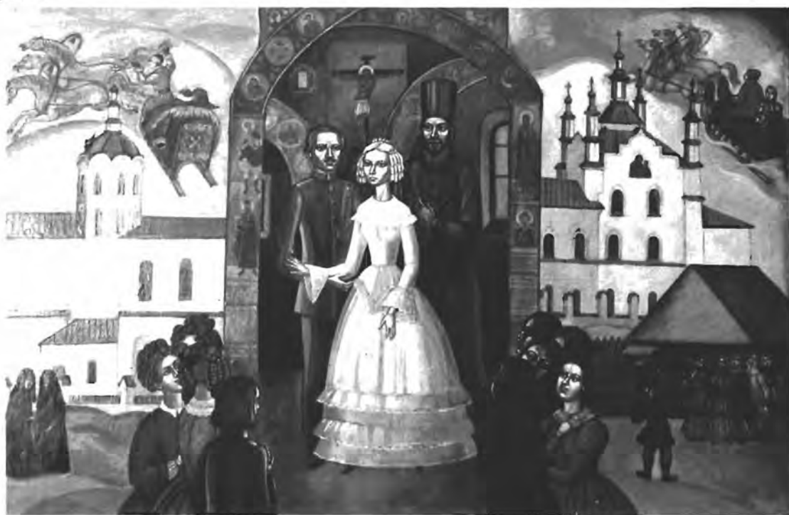
Венчание Достоевского в Кузнецке. С картины А. Ф. Фомченко. Новокузнецк, 1993 г. Холст, яичная темпера. 57х87