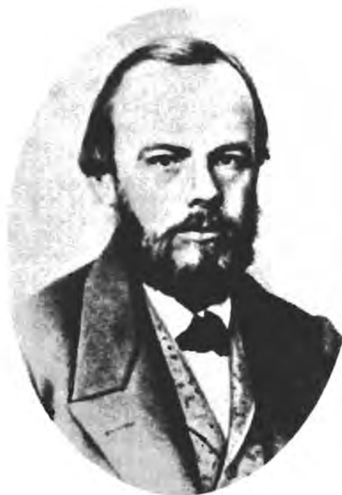
Ф. М. Достоевский с фотографии 1869-го года

К 175-летию со дня рождения Ф. М. Достоевского 1821 — 1996 г.