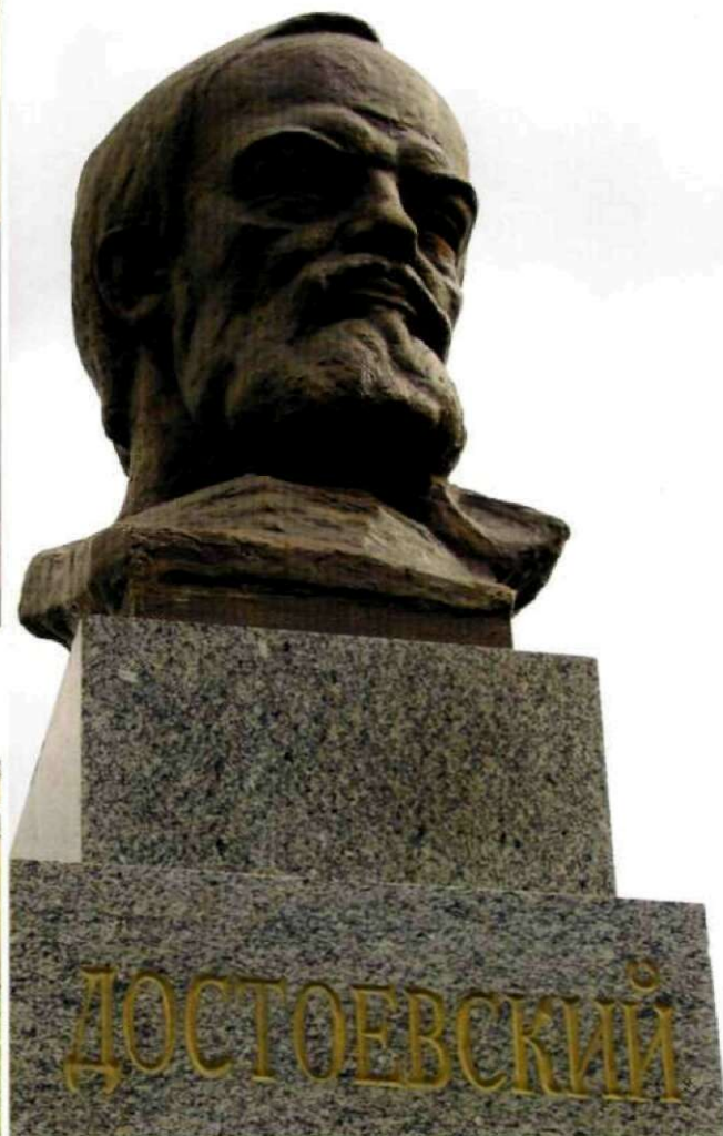
В Одигитриевской церкви города Кузнецка в 1857 году венчались Фёдор Достоевский и Мария Исаева. Писатель дважды приезжал в Кузнецк из Семипалатинска, где отбывал ссылку. Здание, в котором он останавливался, с 1980 года преобразовано в дом-музей Достоевского