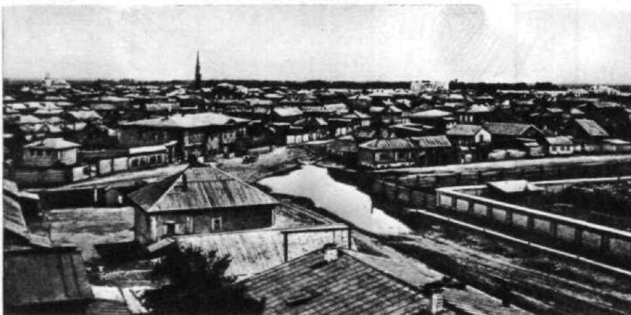
СЕМИПАЛАТИНСК. Фотография. Конец 1850-х гг.