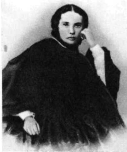
М. Д. ИСАЕВА, ПЕРВАЯ ЖЕНА Ф. М. ДОСТОЕВСКОГО. Фотография. Конец 1850-х гг.

Ф. М. Достоевский — Э. И. Тотлебену. 24 марта 1856 г.