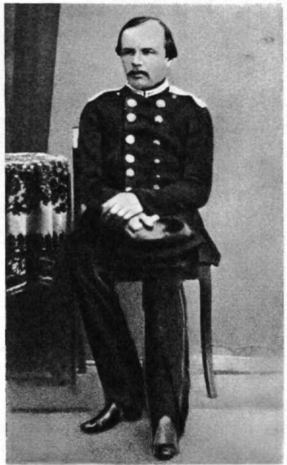
Ф. М. ДОСТОЕВСКИЙ В ФОРМЕ УНТЕР-ОФИЦЕРА. Фотография. 1858 г.