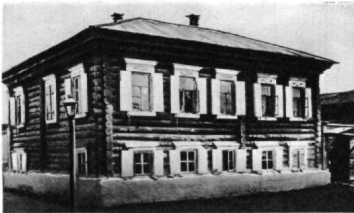
ДОМ ЛЕПУХИНЫХ, ГДЕ Ф. М. ДОСТОЕВСКИЙ ЖИЛ С ЖЕНОЙ ПОСЛЕ ЖЕНИТЬБЫ. Гравюра по фотографии. 1903 г.