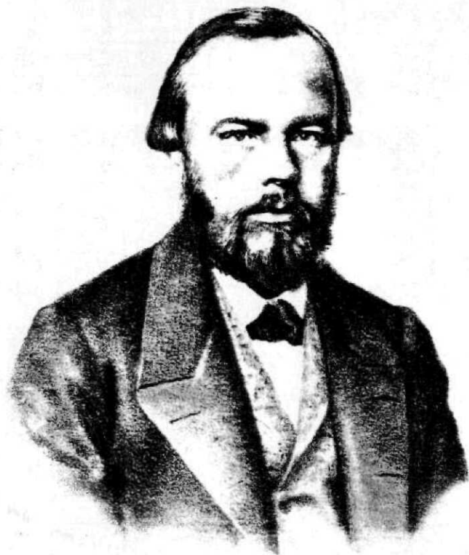
Ф. М. Достоевский. Литография П. Ф. Бореля, 1862 г.