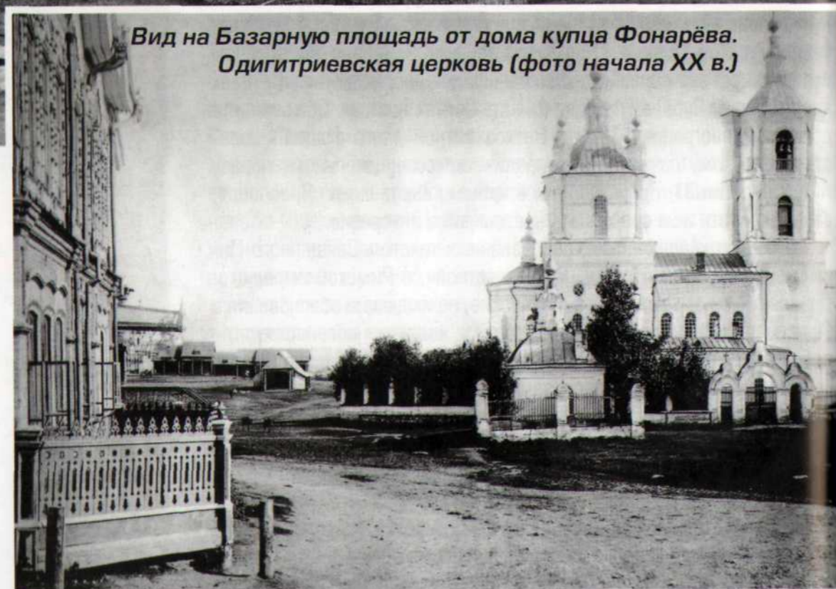
Вид на Базарную площадь от дома купца Фонарёва. Одигитриевская церковь (фото начала XX в.)

Начинался Кузнецк площадью, которая раньше называлась Базарной (ныне Советской) и была деловым центром города. Оформилась она к середине XIX в. На площади находились крупнейшие ма-