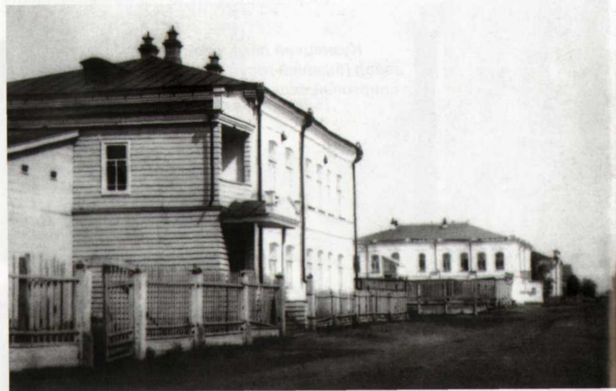
Общий вид на улицу Нагорную (фото 1890-х гг.)