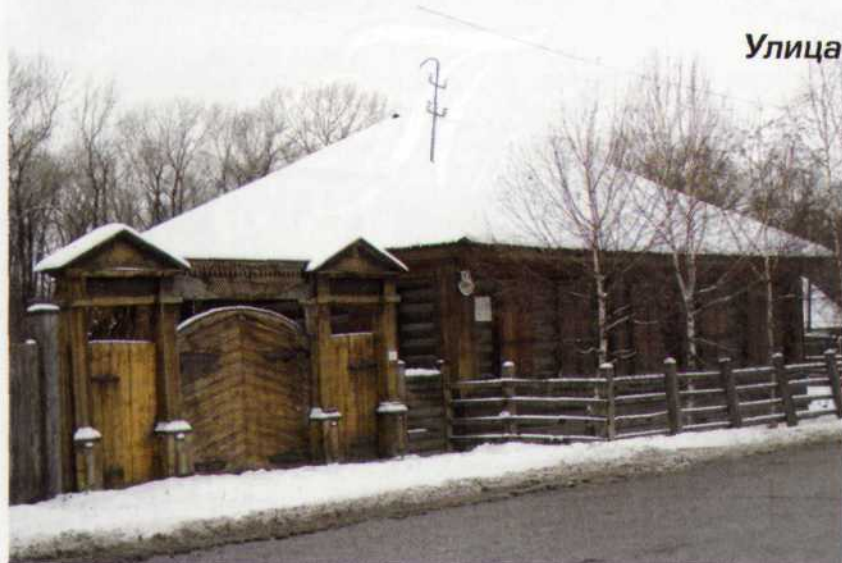
Улица и Дом-музей Ф. М. Достоевского.