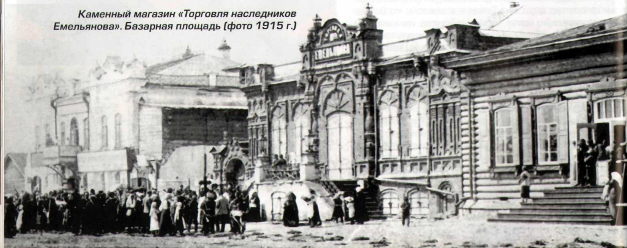
Каменный магазин «Торговля наследников Емельянова». Базарная площадь (фото 1915 г.)

Почта и телеграф — одно из самых примечательных зданий деревянной архитектуры Старого Кузнецка. Своим фасадом дом выходил на Базарную площадь. Усадьба располагалась вдоль Базарного переулка, переименованного позже в улицу Ленина. Перво-