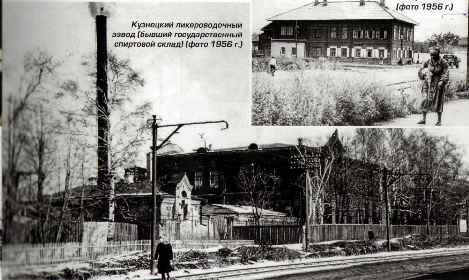
Кузнецкий ликероводочный завод (бывший государственный спиртовой склад) (фото 1956 г.)