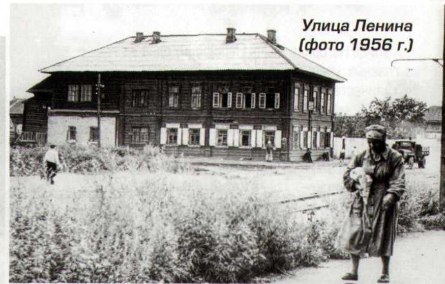
Улица Ленина (фото 1956 г.)

Кузнецкая церковь, построенная в начале XIX в., а при ней имело кладбище. Собственно, здесь и была окраина города Кузнецка. В революционные годы «борьбы за власть» церковь изрядно пострадала, а затем ее разрушили окончательно. В 1930-е годы кладбище перенесли на гору, так как этот квартал вошел в проект застройки Кузнецкого района.