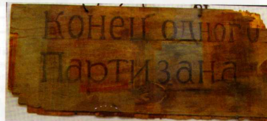
Александр Чекалин. Доска, которую фашисты повесили А. Чекалину на грудь перед казнью

на работу в Москву начальником Главалюминстроя. До последних дней своей жизни он поддерживал связь с заводом.