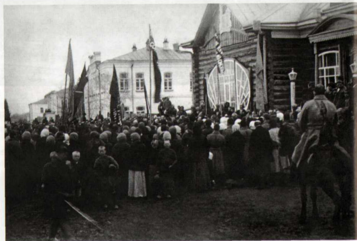
Митинг кузнецчан у Народного дома по случаю Февральской революции (фото 1917 г.)