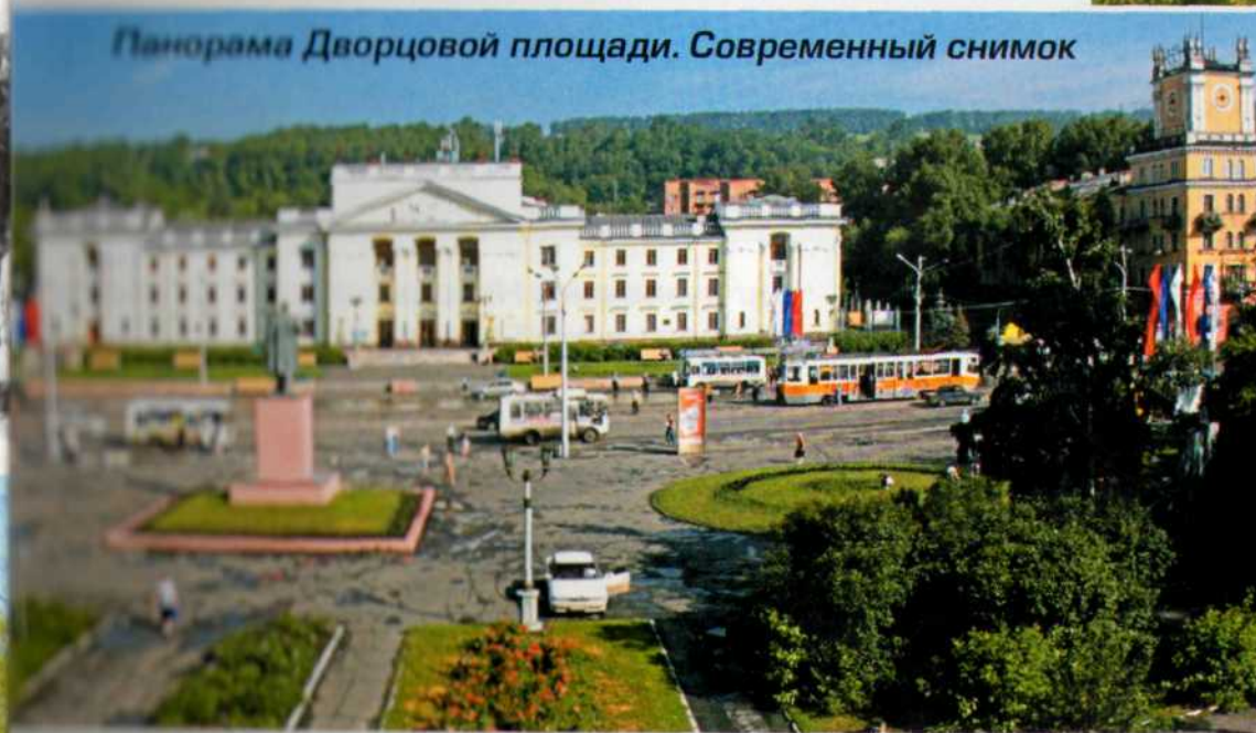
Панорама Дворцовой площади. Современный снимок