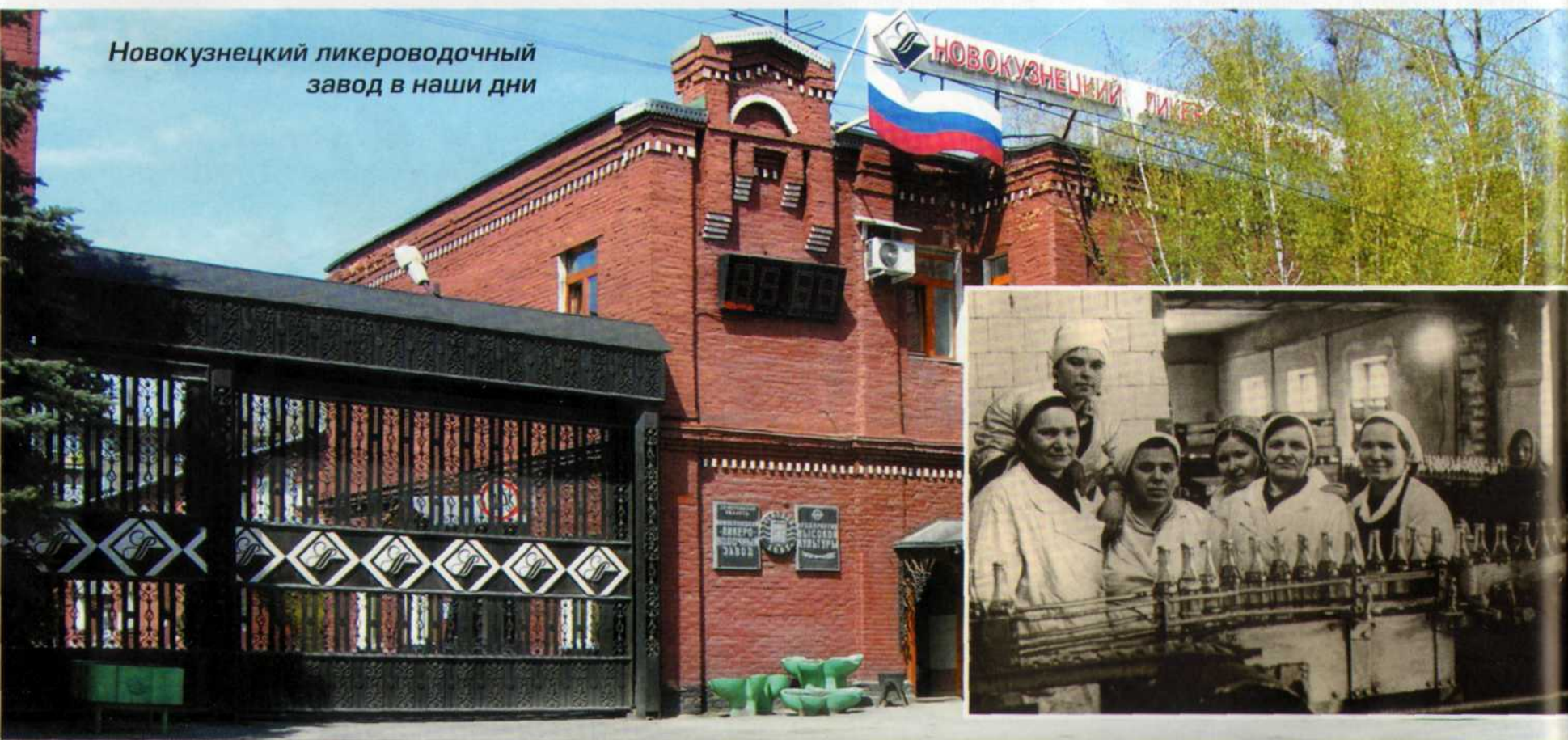
Новокузнецкий ликероводочный завод в наши дни