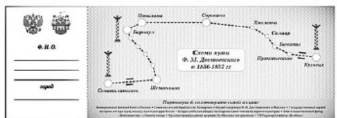
Благотворительный билет Народного проекта «Ф.М. Достоевский в Сибири – навстречу любви!».