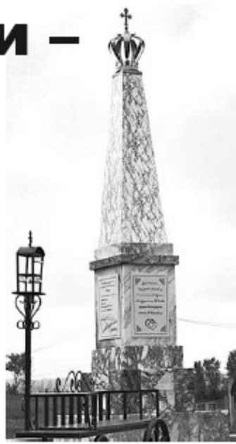
Памятник в виде верстовой пирамиды с солнечными часами высотой 5,3 метра, мрамор. Установлен в поселке Калачево (Прокопьевский район) в 2012 году.